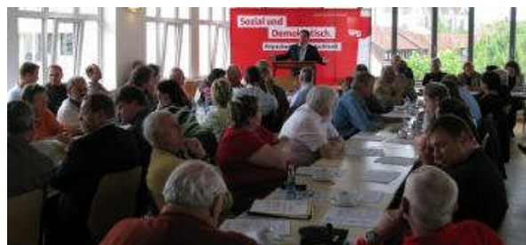
Die SPD Braunschweig bei der Diskussion des Steuer- und Abgabenkonzepts „Wachstum durch Gerechtigkeit“

+++ Das Konzept „Wachstum durch Gerechtigkeit“ kann auf www.hubertus-heil.de heruntergeladen werden. +++