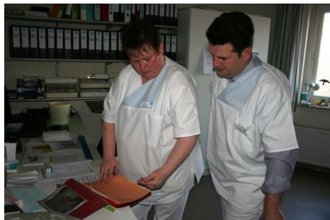
Kurzpraktikum im Philipp-Spitta-Heim

In einer bundesweiten Aktion der SPD absolvierten Abgeordnete die sogenannten Praxistage. Im Rahmen dieser Praxistage konnten die Abgeordneten sich Einblicke in den Betrieb von Gesundheits- und Pflegeeinrichtungen verschaffen und die positiven Aspekte, aber auch die Sorgen und Nöte einer solchen Einrichtung kennenlernen. Hubertus Heil absolvierte ein Kurzpraktikum im Seniorenzentrum Philipp-Spitta-Heim in Peine, wo er den Mitarbeiterinnen und Mitarbeitern über die Schulter schauen konnte. Besonders der Pflegebereich steht angesichts der demographischen Entwicklung vor einer besonderen Herausforderung, da zukünftig immer mehr Pflegeplätze benötigt werden. Dies wurde bei der Abschlussveranstaltung Ende März deutlich, bei der Hubertus Heil mit Vertretern der Pflegebranche, so auch Mitarbeiterinnen und Mitarbeiter des