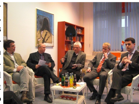
Diskussion bei der Abschlussveranstaltung

Philipp-Spitta-Heims, über die gemachten Erfahrungen sprach. Bemängelt wurde, dass trotz der steigenden Wichtigkeit dieses Berufs der Lohn immer noch gering sei. So entscheiden sich zu wenig Menschen für diesen Beruf, und das, obwohl bereits heute ein Mangel an Fachpersonal besteht. Hubertus Heil kritisierte den nicht ausreichenden Stellenwert von Gesundheit in unserer Gesellschaft: „Wir geben heute prozentual so viel Geld für Gesundheit aus wie vor 30 Jahren, obwohl die Lebenserwartung der Menschen steigt und sich die Medizin weiterentwickelt hat. Dieser Zustand muss geändert werden.“