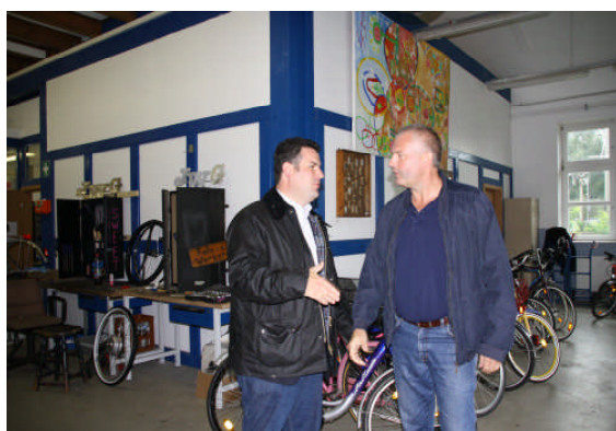
Im Gespräch mit dem Jugendwerkstattleiter