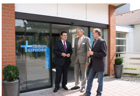
Vor dem Gifhorer Klinikum