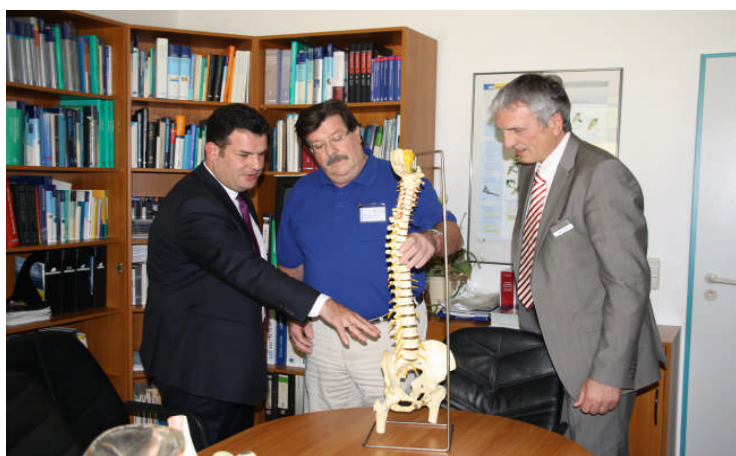
Fachgespräch im Klinikum Gifhorn

Die Kurzpraktika sollten eine Möglichkeit sein, einen Einblick in den Berufsalltag der Menschen zu bekommen sowie neue Projekte und Ideen kennenzulernen. „Ich konnte mit Menschen, die in den Einrichtungen arbeiten, ins Gespräch kommen und mein Wissen über den Gesundheitsbereich und die Pflege auffrischen“, erklärte Hubertus Heil.