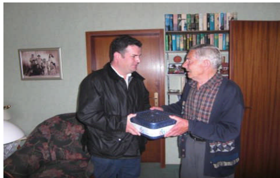
Beim Verteilen von „Essen auf Rädern“ in Peine