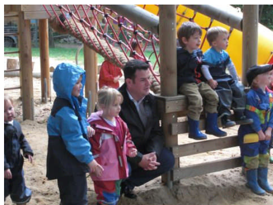
Zu Besuch in der Kita Pusteblume in Broistedt

In der Sommerzeit besuchte Hubertus Heil zahlreiche Institutionen aus dem sozialen Bereich und absolvierte Kurzpraktika, unter anderem in der Altenpflege, einer Kita, dem Paritätischen Wohlfahrtsverband Peine sowie der Jugendwerkstatt Gifhorn. Auch Besuche im Gifhorer Klinikum und im Peiner Südstadtbüro standen auf dem Programm.